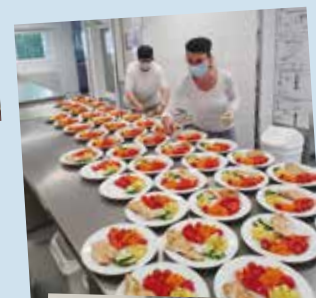
Unsere Küche im Einsatz