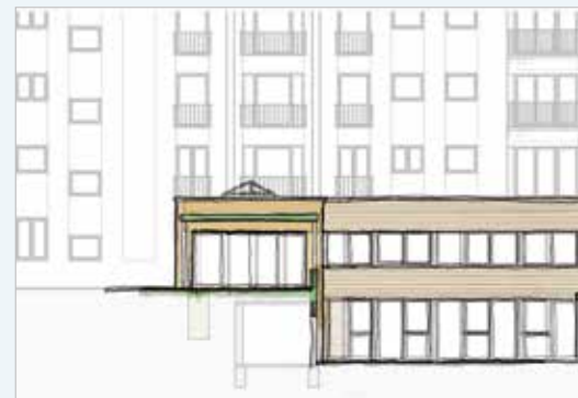
Frontansicht neuer Haupteingang mit Blick auf Großküche und Gästebüro

Nochmals von ganzem Herzen Dank! Wir loben unseren Gott über seiner Treue und Liebe, seiner Größe und Führung, Dank sei Ihm!