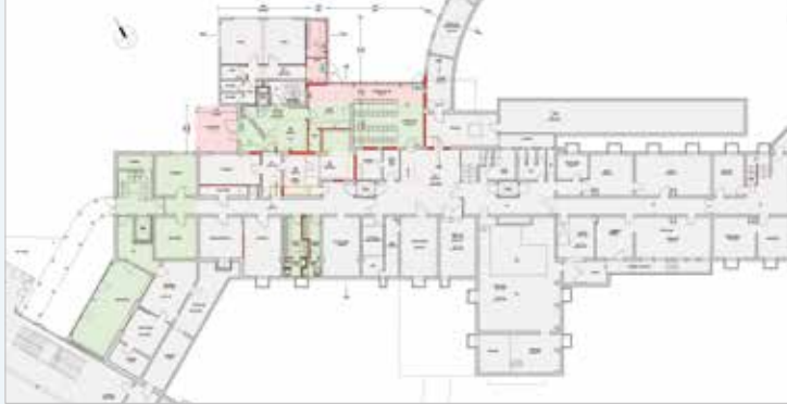
Untergeschoss – die vom Bauprojekt betroffenen Bereiche sind farbig markiert