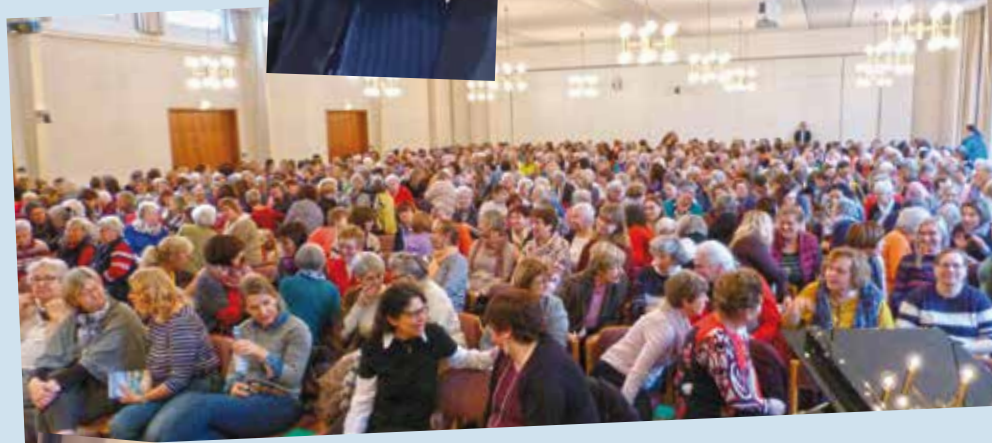
Frauentag: 650 Teilnehmerinnen freuen sich auf einen besonderen Tag