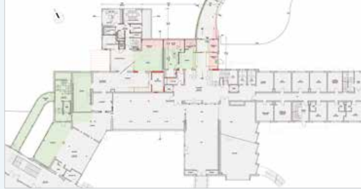
Erdgeschoss – die vom Bauprojekt betroffenen Bereiche sind farbig markiert