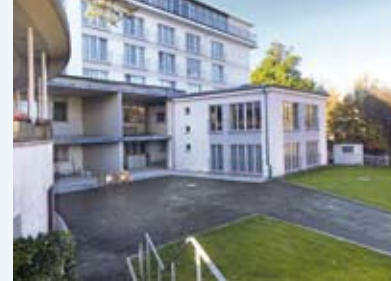
Noch im Rohbau – u. a. zukünftiges Gästebüro