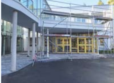
Bauprojekt Westflügel: Arbeiten am Eingang zum Großen Saal