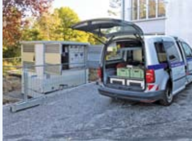
Verlegung der Trafo-Leitung