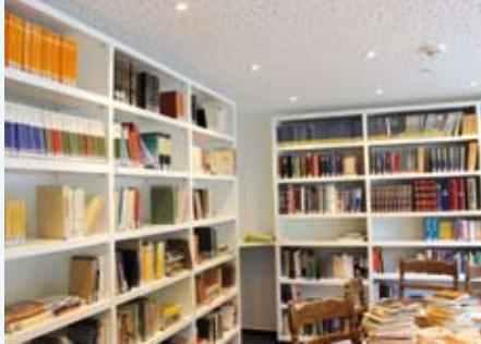
Endlich ist auch unsere neue Bibliothek fast fertiggestellt