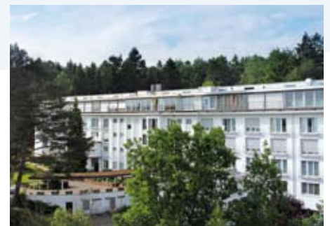
So sieht das Haus in Gesamtperspektive jetzt aus