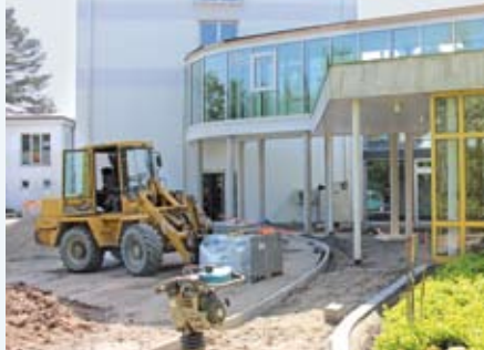
Wir freuen uns auf den neuen Zugang zum Großen Saal