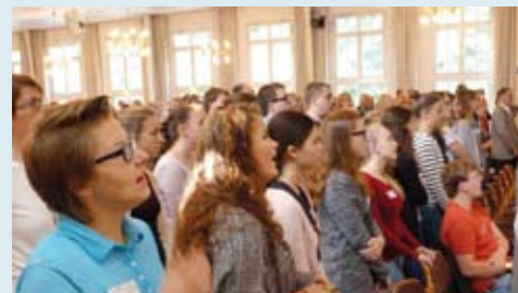
Dabei werden die Schülerinnen und die FSJler begrüßt