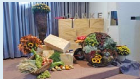
Mit der symbolischen Mauer wollen wir auch für den Westflügel danken