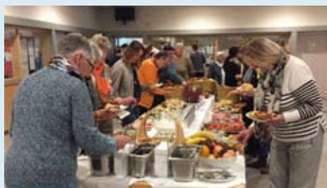
Das erste Frauenfrühstück