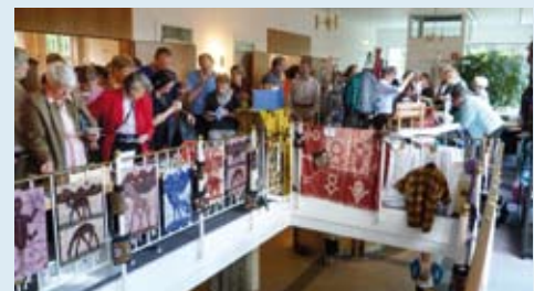
In den Pausen sind die Stände der verschiedenen Missionswerke stark frequentiert