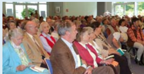
Ein Blick ins Plenum im Kleinen Saal