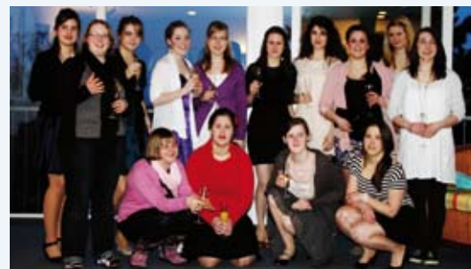
Wir verabschieden uns Ende Juli von unseren Haustöchtern des Jahrgangs 2011/2012