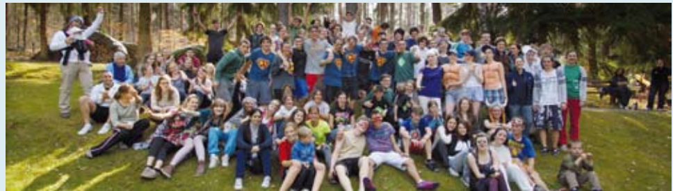
Die gesamte LTC-Truppe – junge Leute aus Deutschland, der Schweiz und Israel