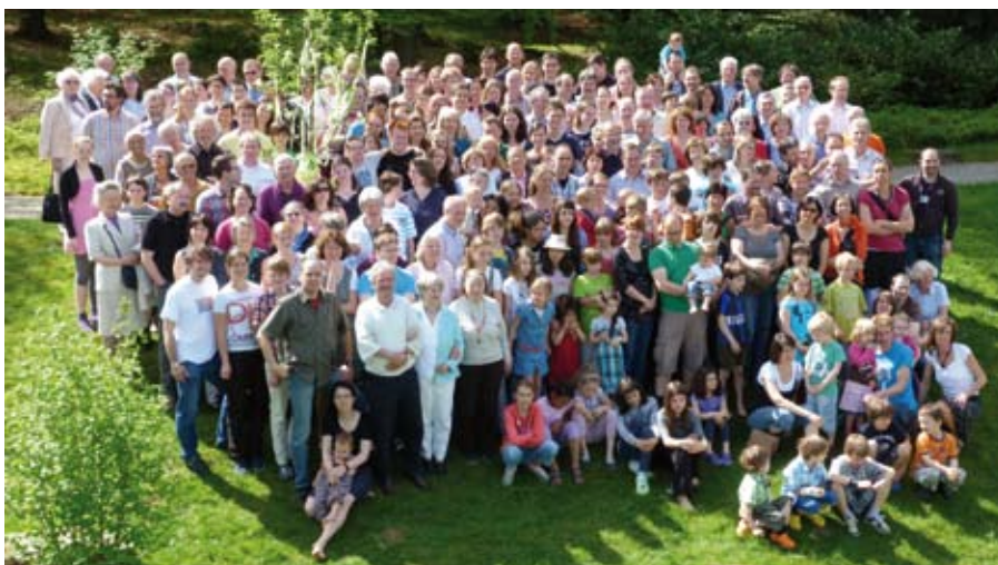
»Wir pflanzen einen Apfelbaum« hieß es zum Abschluss der LaHö-Gemeinde-Freizeit mit dem Thema »Gutes Wachsen: Wurzeln schlagen – Blätter treiben – Früchte bringen«