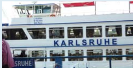
Ein Ausflug fand per Schiff auf dem Rhein statt