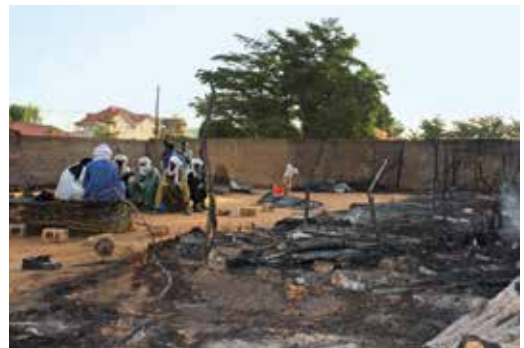
Wenn es brennt, ist alles weg

Da ist eine Mutter-Kind-Klinik, die mit Hilfe verschiedener Unterstützer betrieben wird. Dann gibt es Agrar- und Brunnenprojekte, damit Menschen sich auch in schwierigen Zeiten selbst versorgen können. Es gibt Nähzentren, in denen Frauen dieses Handwerk erlernen.