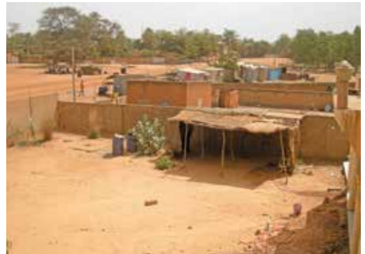
Wer arm ist, lebt auch in der Hauptstadt so