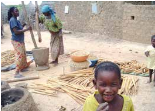
Frauen beim Hirsestampfen