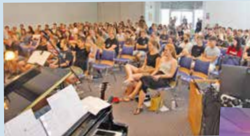
Jugendtag Ein Blick ins Plenum

Den Abschluss des Jugendtages bildete wieder das ganz besondere Praisity-Lobpreiskonzert.