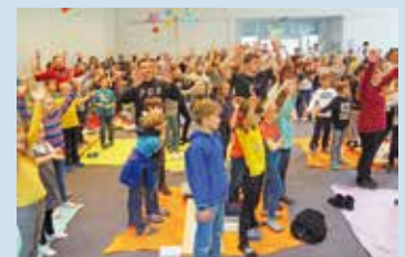
Jungcharfreizeit 150 Jungcharler erleben eine gute gemeinsame Zeit in den Herbstferien.