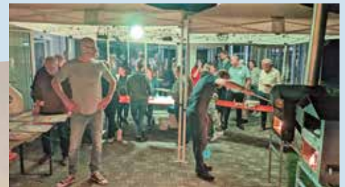
Zeit – einfach fürs Miteinander, hier beim Flammkuchenabend