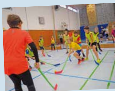
Auch ein intensiver Sportnachmittag gehört mit dazu.