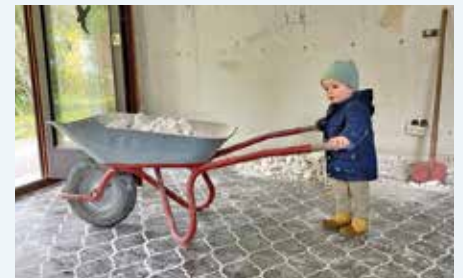
Der aufwendige Umbau vom Landhaus hat sich gelohnt, die energetischen Sanierungsmaßnahmen werden endgültig im Sommer 2024 abgeschlossen – und alle helfen mit.

Zum Vormerken: Jesuswoche 2024 vom 27.2.–3.3.2024