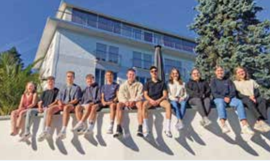
Eine starke Truppe, unsere FSJ-ler 2023/24 im LaHö-Jahresteam und im LaHö-Profil-Jahr