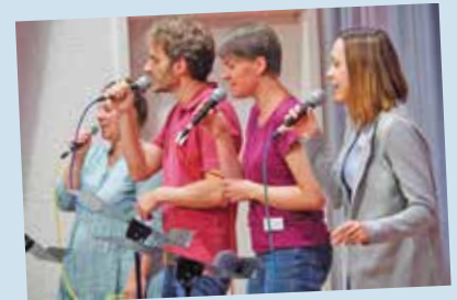
Zeit – zum Gotteslob