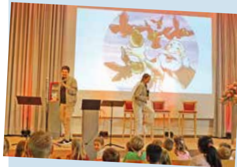
LaHö-Gemeindefreizeit Zeit – besonders gemeinsam mit unseren Kindern