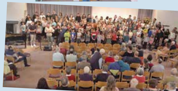
Die gemeinsame Lobpreiszeit im Gottesdienst tut uns gut.